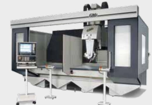
ALPHA T Contura